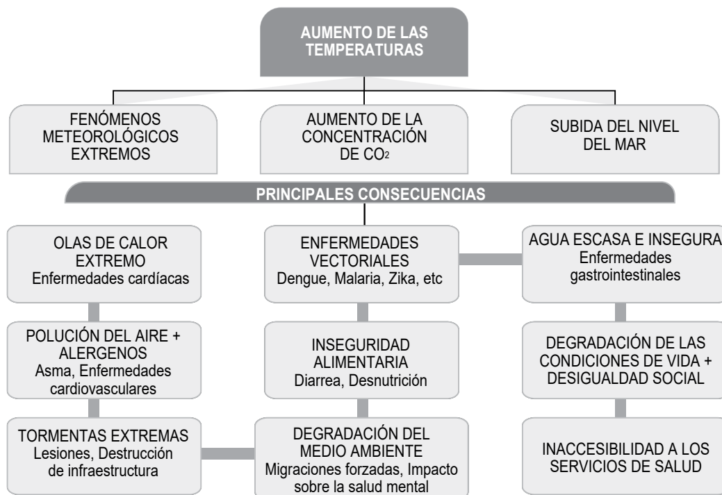
Figura 1. Efecto del calentamiento global inducido por causas antropogénicas y sus consecuencias sobre la salud humana (Fuente: preparación del diagrama a partir de referencia 5).

Debido a las influencias del cambio climático sobre los determinantes sociales y medioambientales de la salud (aire limpio, agua potable, alimentos suficientes, vivienda segura) se prevé, si no se consolidan medidas intervencionistas para detener el rápido calentamiento global, que entre 2030 y 2050 el calentamiento global y la contaminación aérea causará unas 250,000 defunciones adicionales cada año debido a malnutrición, arbovirosis, malaria, diarrea y estrés calórico. 29