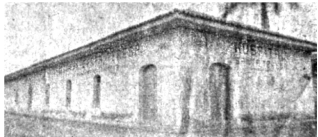
Figura 1. Hospital Santa Teresa, década de 1930. Revista Anales del Hospital Santa Teresa, volumen 1, número 1, página 1.

En este artículo se describe la historia de la fundación legal, la construcción y los primeros años de operación del Hospital Santa Teresa de Comayagua, con el objetivo de dar a conocer las dificultades y vicisitudes del establecimiento de un hospital en la Honduras de la década de 1930 ver Figura 1 . El Hospital Santa Teresa de Comayagua fue creado para suplir la carencia de un centro de salud en la zona central del país. 1 Desde el decreto de su fundación en 1931, tuvieron que pasar cinco años para que el establecimiento comenzara a funcionar. En este artículo histórico se presenta un recorrido desde la creación del hospital, pasando por el trabajo de la junta directiva para ponerlo en marcha hasta su inauguración en 1936, y las cifras de sus primeros años. El Hospital comenzó a funcionar en el gobierno de Tiburcio Carías Andino (1933-1949), por lo que se ha utilizado este periodo presidencial para fijar los límites históricos. La información de este artículo proviene de los informes que la junta directiva y el director del Hospital dirigían al