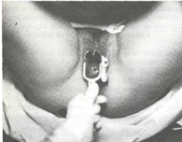
Cuello uterino totalmente formado 4 meses después de criocirugía Moradel M.A. 1987.