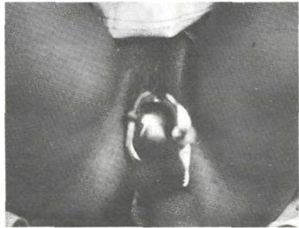
Imagen del cuello uterino durante la aplicación de criocirugía Moradel M.A. 1987,